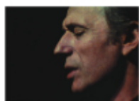
La solitude du chanteur de fond A black and white portrait of Yves Montand, the singer featured in the film 'La solitude du chanteur de fond'.

1964年、東京オリンピックに湧く高度成長真っ只中の日本を、フランス語を学ぶ満州生まれのひとりの日本人女性を通して描いた映画エッセイ。