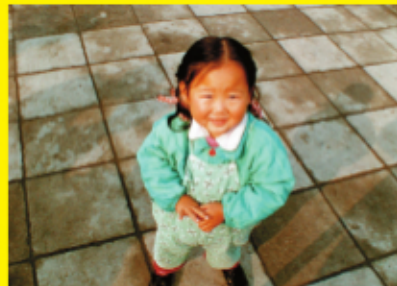
北京の日曜日 Dimanche à Pékin (1956) Dimanche à Pékin restored with support of the Centre national du Cinéma (Paris-France) CNC