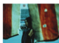
Le mystère Koumiko A black and white photograph of a woman, likely from the film 'Le mystère Koumiko'.

1948年の建国以来12年目を迎えたイスラエルの複雑な現実を描く。1967年の第三次中東戦争以降、マルケル自身によって上映を禁じられていた。