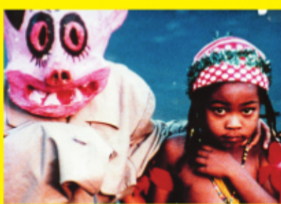
サン・ソレイユ Sans soleil (1982)

クリス・マルケルは世界のあらゆる場所にいるのどこにも見つからず この世を去ってなお不死を約束されている —— 岡田秀則 (映画研究者)