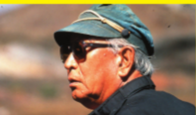
A.K. ドキュメント黒澤明 A.K. (1985)