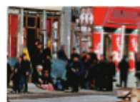
Dimanche à Pékin A black and white photograph of a group of people in a public square in Beijing, likely Tiananmen Square, during the 1989 protests.

北京の日曜日(1956) シベリアからの手紙(1958) 宇宙飛行士(1959) ある闘いの記述(1960) 美しい五月(1962) 不思議なクミコ(1965) ベトナムから逃く(1967) イヴ・モンタン〜ある長距離歌手の孤独(1974) 空気の底は赤い(1977) サン・ソレイユ(1982) A.K. ドキュメント黒澤明(1985) 音楽を聴く猫(1990) アレクサンドルの墓:最後のボルシェヴィキ(1993) レベル5(1996) アン・ドレイ・アルセニエヴィッチの1日(1999) 未来の記憶(2001) 笑う猫事件(2004)