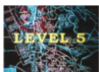
Level 5 A colorful abstract image with the text 'LEVEL 5' overlaid, likely from the film 'Level 5'.

黒澤明監督による日仏合作映画「乱」の撮影過程を記録したドキュメンタリー。数多くのスタッフやエキストラが行き交う大掛かりな撮影現場。彼らに混じって武満徹の姿も。臨場感のある画面はクリス・マルケルの別の顔である。