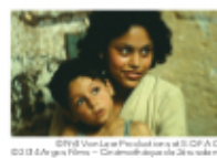
Description d'un combat A black and white photograph of a woman and a child, likely from the film 'Description of a Combat'.

開発途上のシベリアの街と風景や人々の様子を、アニメーションやアーカイブ映像を挿入しつつ書簡形式のナレーションで描く。“シネ・エッセイ”の作家として注目された一作。