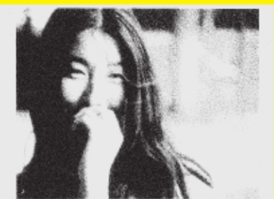
不思議なクミコ Le mystère Koumiko (1965)