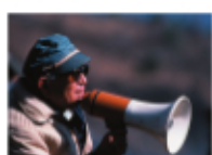
A.K. A black and white photograph of a person with a megaphone, likely from the film 'A.K. Document Kurosawa'.

世界を旅するカメラマンから届いた手紙を朗読する女性。日本とアフリカ、記憶や旅をテーマに、フィクションやドキュメンタリー、哲学的考察が混在したマルケルの代表作の一本。