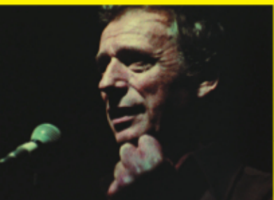
イヴ・モンタン〜ある長距離歌手の孤独 La solitude du chanteur de fond (1974) La solitude du chanteur de fond restored with support of the Centre national du Cinéma (Paris-France) CNC