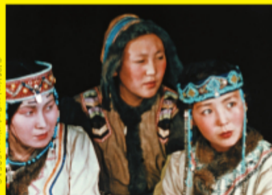
シベリアからの手紙 Lettre de Sibirie (1958) Lettre de Sibirie restored with support of the Centre national du Cinéma (Paris-France) CNC