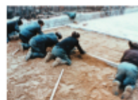
Lettre de Sibérie A black and white photograph of a snowy street scene in Siberia, with people walking and buildings in the background.

1955年、中国友好使節団旅行にマルケル自身が参加した際に撮影した映像をもとに、ある日曜日のスケッチとして革命後の北京の人々や風景を鮮やかに描いた初期短編。本作ではマルケルは撮影も自分で担っている。