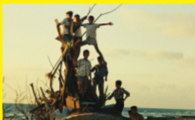
ある闘いの記述 Description d'un combat (1960)