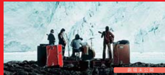
📺 サウンド・オブ・レボリューション