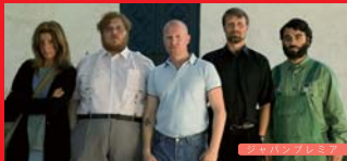
📺 アダムズ・アップル

日本とデンマークの外交関係樹立 150周年を記念して、デンマークにフォーカスする。ファン待望の未公開作から、社会現象にもなったTVシリーズ一挙上映イベント、知られざるサイレント映画の大女優を特集するほか、グリーンランドの伝説的ロックバンドにスポットを当てた音楽ドキュメンタリーまで、デンマーク映画界が世界に誇る新旧の傑作をお届け!