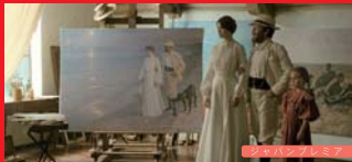
📺 マリー・クロヤー

👑 2006年デンマーク・アカデミー (ロバート)賞: 作品賞、脚本賞、特殊効果 / 国際賞 2/11 Sat 19:00 2/14 Tue 16:30 2/17 Fri 21:00 ユーロスペース