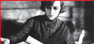
アスタ・ニールセン Asta Nielsen